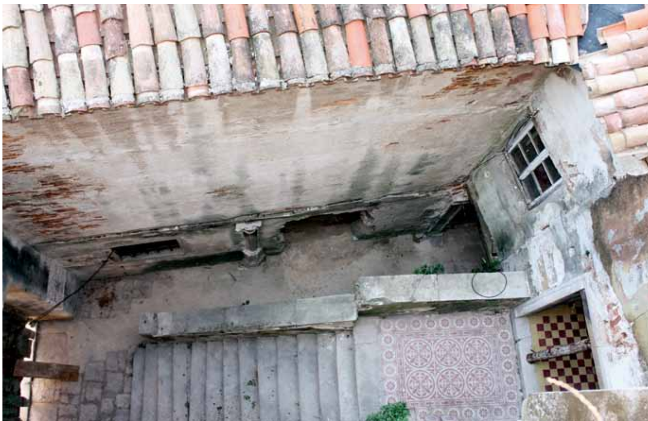
11. Istočno dvorište sa trijemom

onodobnu suvremenu arhitektonskom izričaju. Zapadna trećina kuće u 19. je stoljeću pripadala drugim vlasnicima koji su očuvali renesansne elemente, pa tako i danas derutnu drvenu potkrovnju strehu i renesansne monofore sjevernog pročelja. Razlog je očito u manjoj platežnoj moći tadašnjih vlasnika koji su i na zapadnom pročelju zadržali renesansne elemente otvora, no preinake su provedene nasumičnom reupotrebom fragmenata. Središnji portal prvog kata ima profilirane dovratnike nad koje je postavljen nepripadajući nadvratnik ukrašen zupcima. U središtu nadvratnika je grb s prikazom lava koji u šapi drži šestokraku zvijezdu (sl. 10). To je jedini grb obitelji Moise na pročeljima kuće, a ostali grbovi pripadaju obitelji Petris, pa tako i grb iznad portala. Uz rekonstruirani portal postavljen je cjelovit portal profilirana okvira s izmjeničnim zupcima na nadvratniku i grbom obitelji Petris u biljnom vijencu. Osim kuće Marcello-Petris ostale patricijske kuće u Cresu nemaju portale ukrašene dentima. Portal ukrašen izmjeničnim zupcima na kući Marcello-Petris postavljen je na reprezentativnome zapadnom pročelju. Tako ukrašen portal predstavlja i glavni ulaz u rezidencijalni dio