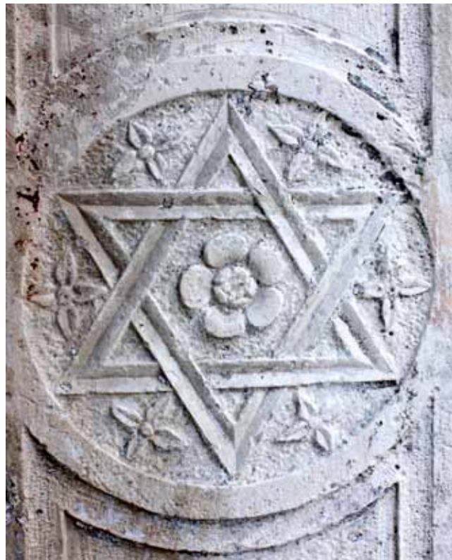
4. Medaljon na unutarnjoj strani doprozornika zapadne renesansne monofore sjevernog pročelja

Medallion on the inner side of the frame of the east single-light Renaissance window on the north front