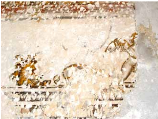
8. Nalaz oslika u središnjoj dvorani prvog kata Remains of the wall paintings in the central hall on the first floor

mjestu šireg zazidanog portala čiji su obrisi čitljivi u strukturi zida. Zapadni portal je dućanski otvor, zazidan, ali očuvanog klesanog rasteretnog luka i okvira ukrašena motivom štapa. Neujednačen ritam prizemnih portala, nepodudarnost s organizacijom otvora katova i njihovo oblikovanje govore u prilog gospodarskoj funkciji prizemlja koje izvorno nije imalo unutarnju vertikalnu komunikaciju s rezidencijalnim katovima. Starije jednokrako unutarnje stubište povezivalo je etaže od prvog do trećeg kata, a postojeće je naknadno umetnuto u strukturu kuće, vjerojatno uslijed vlasničke podjele građevine u 19. stoljeću te radi potrebe formiranja „udobnije” vertikalne komunikacije između katova, dvokrakim stubištem. 39