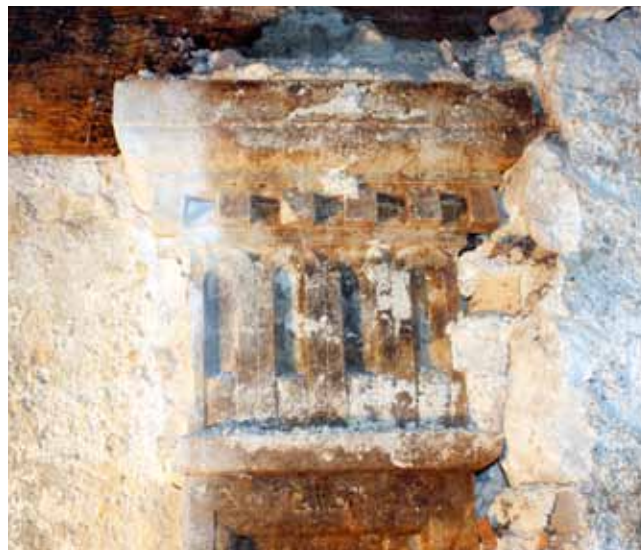
13. Stupac trijema utopljen u recentniji zid, stanje nakon uklanjanja žbuke

Pillar of the porch enveloped by a later wall, situation after the removal of the plaster