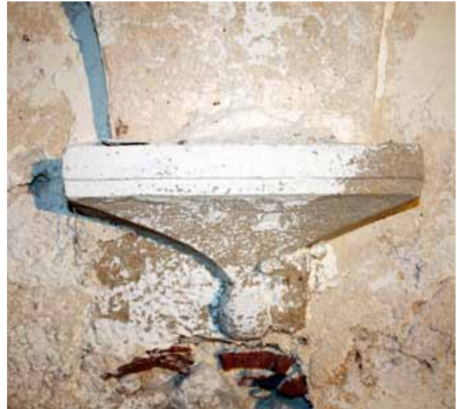
5. Svod prizemlja, peta susvodnice Vault on the ground floor, the springing of the vault rib

Na prvom austrijskome katastarskom planu iz 1821. godine, uz zapadno pročelje kuće smješteno je veliko ograđeno dvorište koje na planu iz 1873. godine biva prepolovljeno izgradnjom novije stambene građevine i stubišta, 33 a poslije potpuno anulirano izgradnjom prizemne gospodarske građevine. Već je na prvome katastarskom planu kuća razdijeljena u dvije nejednake katastarske čestice, od kojih zapadna odgovara dijelu kuće na čijim su pročeljima uglavnom zadržani renesansni arhitektonski elementi, a istočna čestica dijelu kuće koji