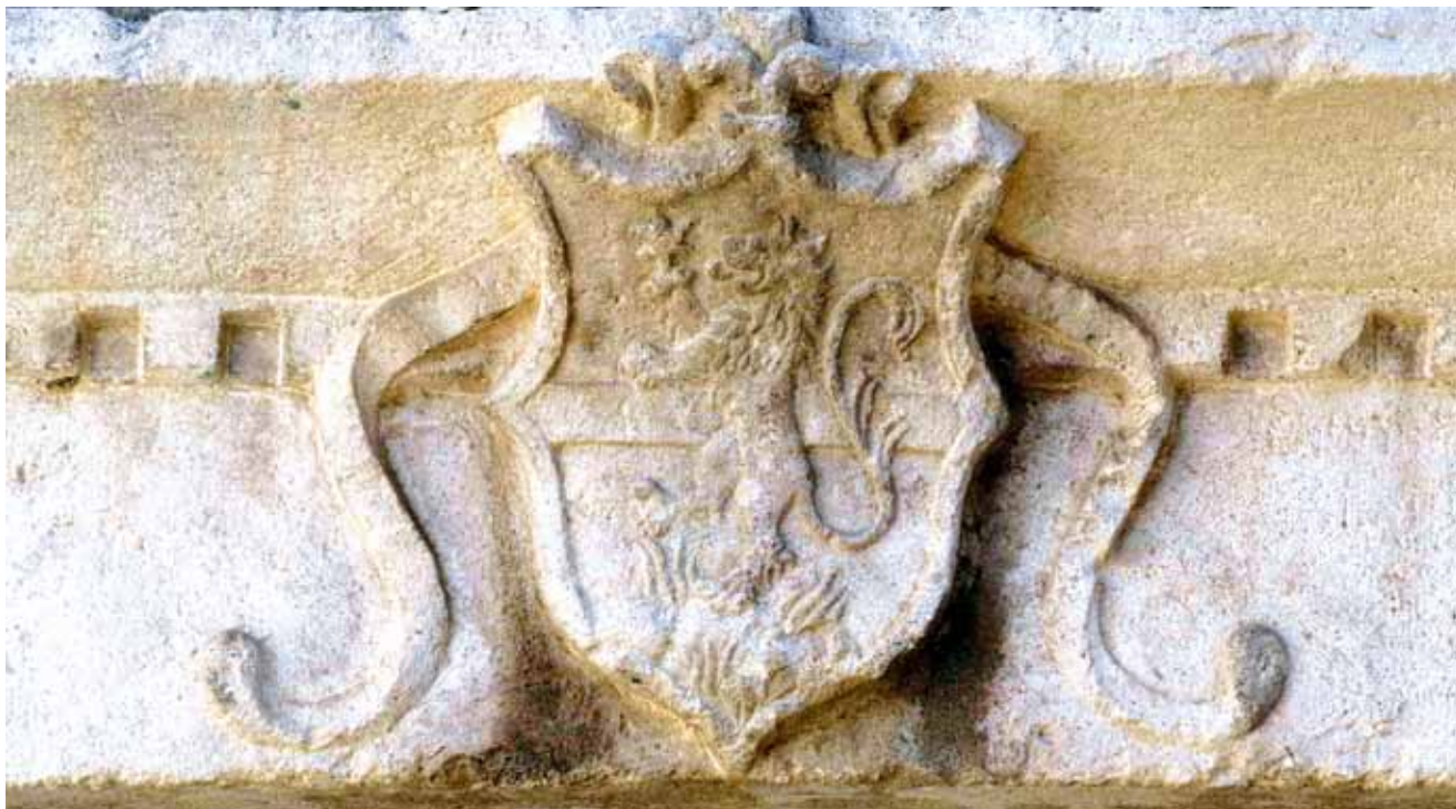
10. Grb obitelji Moise na nadvratniku portala zapadnog pročelja The Moise family coat-of-arms on the lintel of the portal in the west front

pozicijama, pomaknutima na zapad. Skoro sve opisane komunikacije bile su naknadno zazidane ili pretvorene u zidne niše, a uslijed promjene tlocrtnih shema interijera, nosivi zidovi rastvarani su novim otvorima.