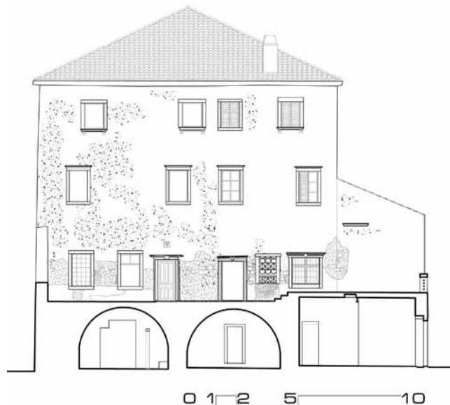
9. Zapadno pročelje kuće Moise - presjek kroz zapadno dvorište, snimak postojećeg stanja nakon konzervatorskih istraživanja

Prvi i drugi kat ponavljaju jednaku tlocrtnu shemu s trima prostorijama okrenutima prema sjevernome reprezentativnom pročelju (sl. 7). Te su prostorije razdijeljene nosivim zidovima, a nosivi zid proteže se i u pravcu istok – zapad, odjeljujući sjeverni i južni dio kuće. Budući da je nosivi zid izostavljen između središnje sjeverne prostorije i južnog dijela kuće na prvome i drugom katu, zaključuje se da je tlocrt bio koncipiran prema dobro poznatu principu središnje dvorane i četiriju bočnih prostorija ( ‘Quattro stanze, un salon’ ). Istražnim radovima ustanovljeno je da su na obama katovima povijesne komunikacije među prostorijama postavljene na istim pozicijama: središnja dvorana komunicira s bočnim sjevernim prostorijama aksijalno postavljenim vratima pomaknutim prema središtu kuće, a bočne prostorije međusobno komuniciraju vratima na istim