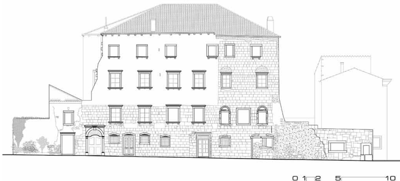
1. Sjeverno pročelje kuće Moise, snimak postojećeg stanja nakon konzervatorskih istraživanja

Riječ je o novom tipu stambenih građevina, gradskim kućama creskog plemstva koje gradi lokalna radionica formirana na izgradnji zborne crkve Sv. Marije Snježne. Tu su cresku klesarsku radionicu definirali Jasenka Gudelj i Laris Borić 13 analizom arhivskih dokumenata tragom ranijih autora. 14 Navedeni autori ističu niz imena majstora koji se u arhivskim dokumentima spominju kao magistri, muratori i lapicide , a u prvom redu su to članovi obitelji Marangon (Marangonich) i Giovanni da Bergamo, graditelj biskupske palače u Osoru. Gianna Duda Marinelli identificirala je protomagistra creske zborne crkve, Francesca Marangonicha ( Francesco magistro de la ditta fabbrica ), 15 što usvajaju i recentniji tekstovi o renesansnom graditeljstvu i kiparstvu na Kvarneru, u kojima se majstor Francesco ističe kao vodeći majstor creske kamenoklesarske radionice koja je bila aktivna i na ostalim kvarnerskim otocima. Marijan