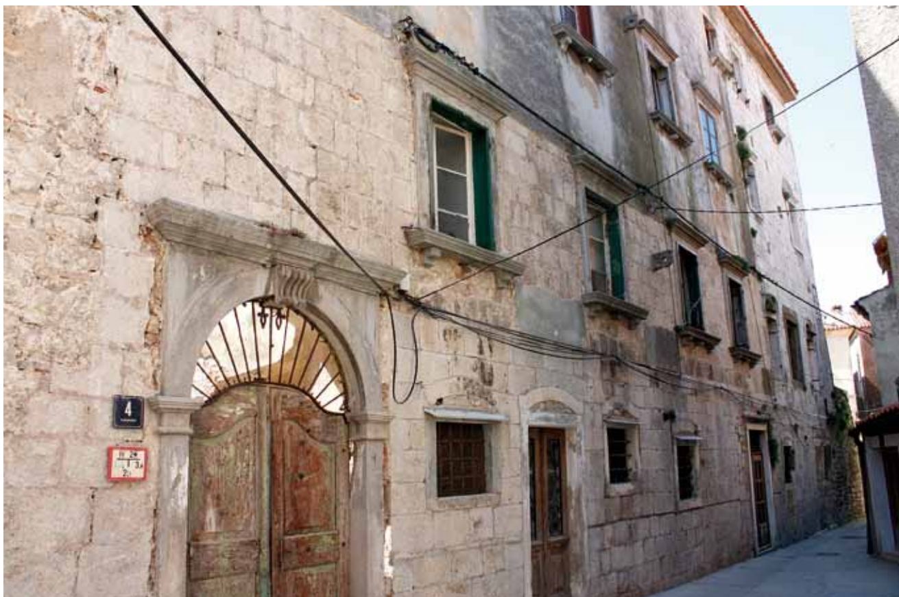
2. Sjeverno pročelje kuće Moise nakon konzervatorskih istraživanja The north front of the Moise house after the conservation works

Bradanović opisuje rad majstora Franje na Krku, a potom i na Rabu, navodeći da je „punu recepciju renesansnog stila u gradu Krku omogućio tek dolazak radionice okupljene oko majstora Franje, ranije formirane na susjednim osorskim i creskim gradilištima.” 16 Predrag Marković poistovjećuje creskog graditelja i klesara Francesca Marangona s istoimenim majstorom koji se uz Giovannija da Bergama spominje na gradnjama Maura Codussija u Veneciji i zaključuje da je riječ o arhivski potvrđenu lombardskom kamenoklesaru koji se doselio na Cres, unijevši prepoznatljive motive lombardsko-venetske rane renesanse na kvarnerske otoke. 17