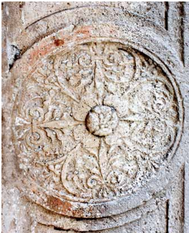
3. Medaljon na unutarnjoj strani doprozornika istočne renesansne monofore sjevernog pročelja

Obitelj se u creskim knjigama Gradskog vijeća spominje imenom Moise, Moyse, Moisis i Moysis. 26 U prvoj knjizi Gradskog vijeća 1495. godine spominje se creski župnik Moise de Moisis. Godine 1501. u Gradsko vijeće ulazi Moise, sin Giorgija de Moysisa/de Moisea. 27 Giorgio Moise imao je u Gradskom vijeću ulogu suca, odnosno bio je jedan od četiriju članova Poglavarstva. Sin Moisea de Moysisa je Andrea, koji od 1535. godine vrši funkciju predstavnika fontika. U recentnijoj povijesti najznamenitiji član te creske obitelji je Giovanni Moise (Cres, 1820.-1888.), lingvist, gramatičar i pisac, 28 po kojemu je nazvana ulica u kojoj je smještena kuća Moise u Cresu.