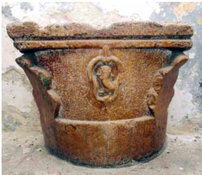
12. Kruna zdenca

U podu ispod volte stubišta pronađen je kružni pravilno zidan otvor zdenca čija je kruna danas pohranjena u prizemlju kuće (sl. 12). Kruna zdenca nosi grb obitelji Moise datiran u 16.-17. stoljeće, 44 profiliranog je završnog vijenca i s mesnatim listovima na kutovima oplošja. Na vijencu je uklesana nečitka godina koja završava brojevima XXXXIII. Kruna je zatečena raspolovljena i ugrađena u sekundarne